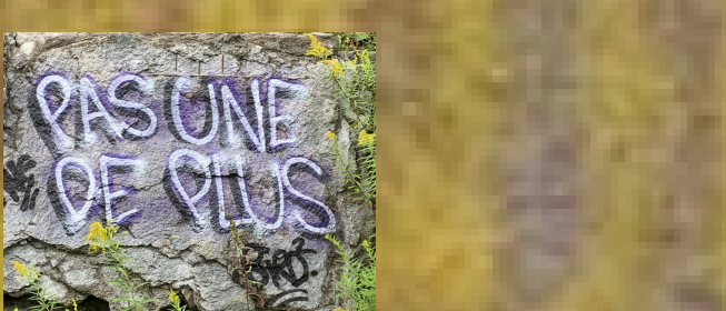
(Grafitti pour pas de plus dans (Montmorency)

© DDM-L Avoie Juin 2024 6 cordes acoustique dreadnought